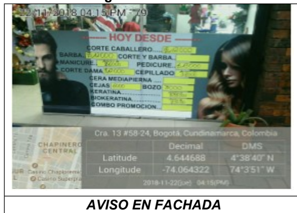
AVISO EN FACHADA